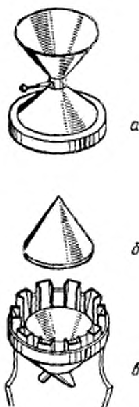
Рисунок 1 — Трехмногообразное изображение технического конического сепаратора а — воронка, б — конус; в — перевернутая воронка

делению, поступает на поверхность конуса с делениями (рисунок 1б), вершина которого расположена непосредственно под центром нижнего отверстия в воронке с делениями. Материал, стекающий по конусу, отводится в серию приемников, расположенных по окружности перевернутой воронки (рисунок 1в) у основания конуса (рисунок 1б).