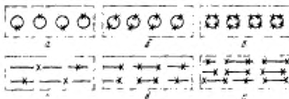
а—расположение 4 точек отбора в одном вагоне при загрузке конусами; б—расположение 8 точек отбора в одном вагоне при загрузке конусами; в—расположение 16 точек отбора в одном вагоне при загрузке конусами; г—расположение 4 точек отбора в одном вагоне при загрузке ровным слоем; д—расположение 8 точек отбора в одном вагоне при загрузке ровным слоем; е—расположение 15 точек отбора в одном вагоне при загрузке ровным слоем